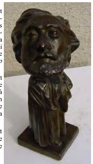
Statue à charge de Gambetta par Calmon

On doit voir en lui, finalement, le représentant et le serviteur accompli, jusqu'à l'excès, de cette esthétique néogothique que l'on trouve dans tant et tant d'églises de notre Quercy. (avec l'aimable complicité d'Etienne Baux)