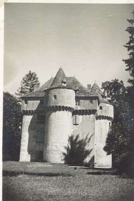
3532 Chateau de Guignac ou de Verdale