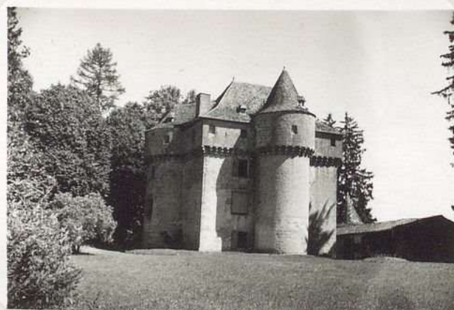
3533 Chateau de Guignac ou de Verdale