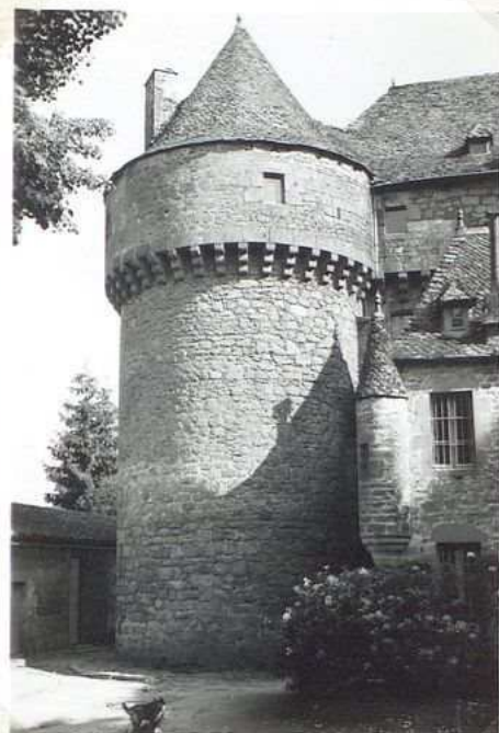
12428 Chateau de Guignac