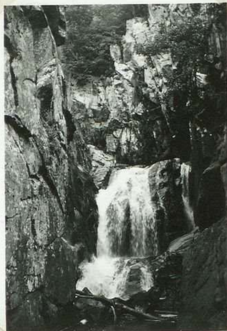
2003. Le Saut. Grand