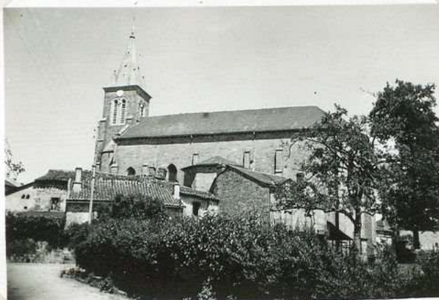
3529 Eglise de Souceyrac