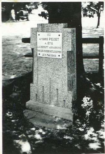
3521 Stèle Andre' Pezet