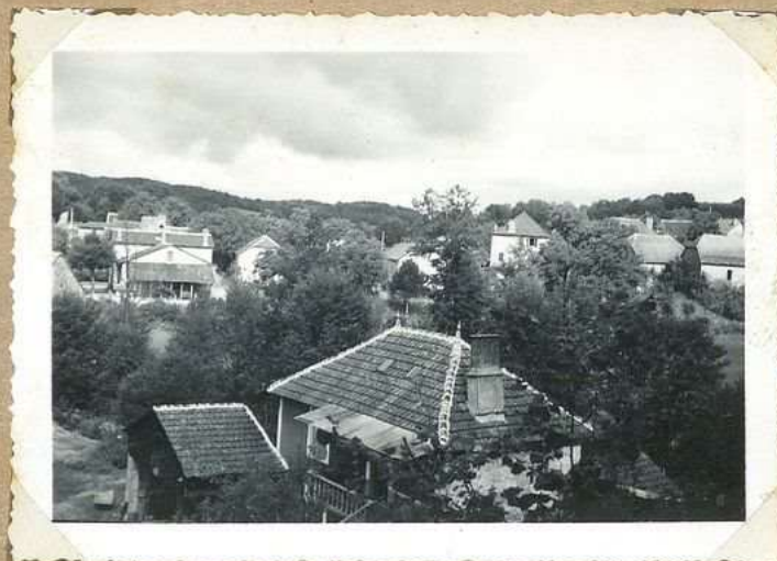
1068 - Vue générale