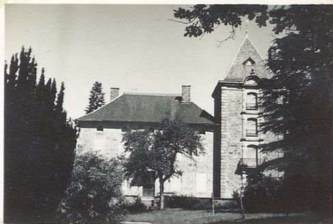
3527 Chateau de Traysse