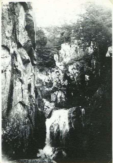
2002. Le Saut. Grand