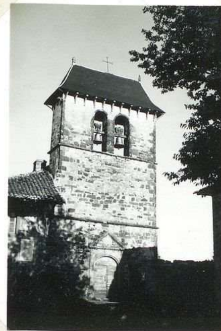
689. Eglise de Pontverny