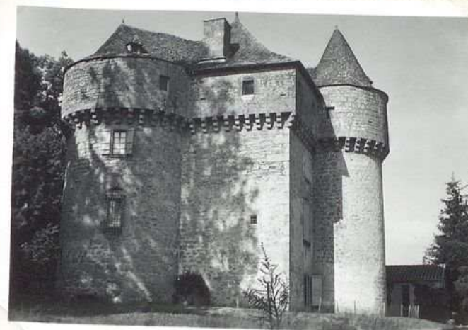
12429 Chateau de Guignac