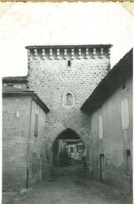
3519 Porte Notre Dame