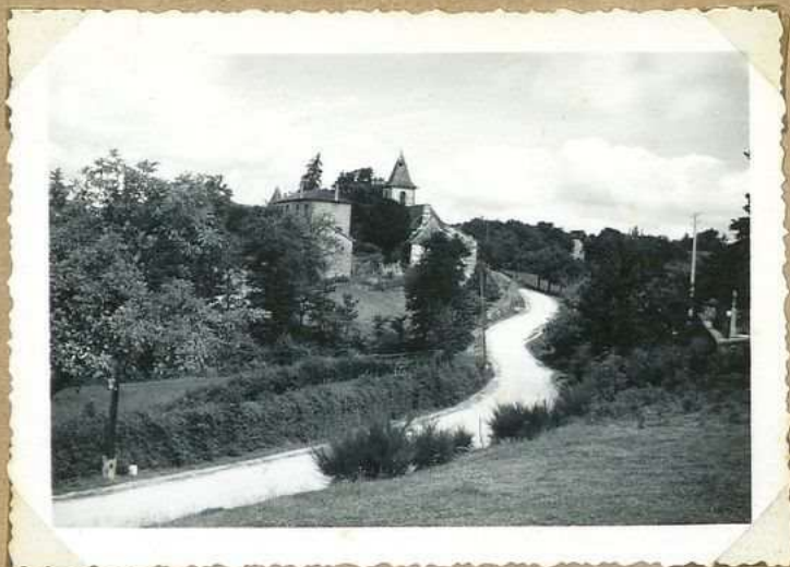
2110. Vue générale E