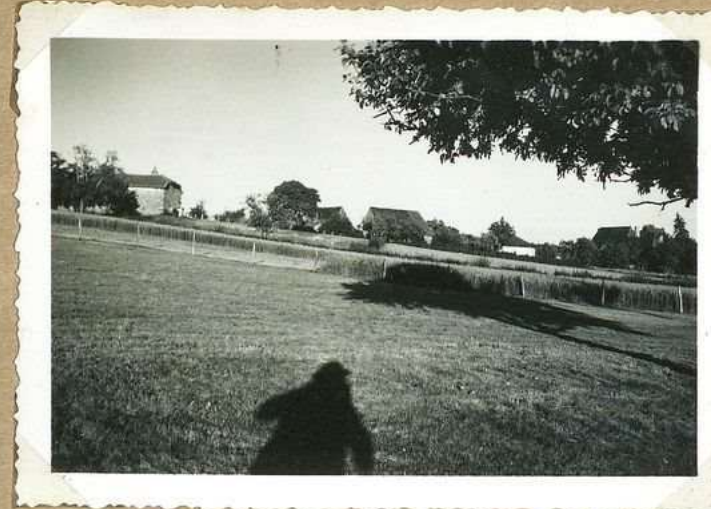
6176. Vue générale. O