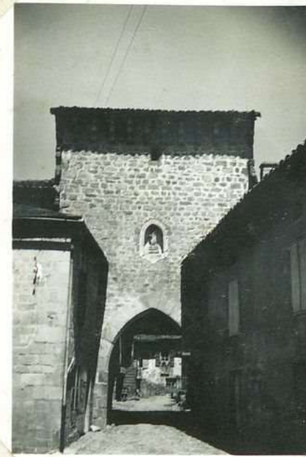
3531 Porte Notre Dame