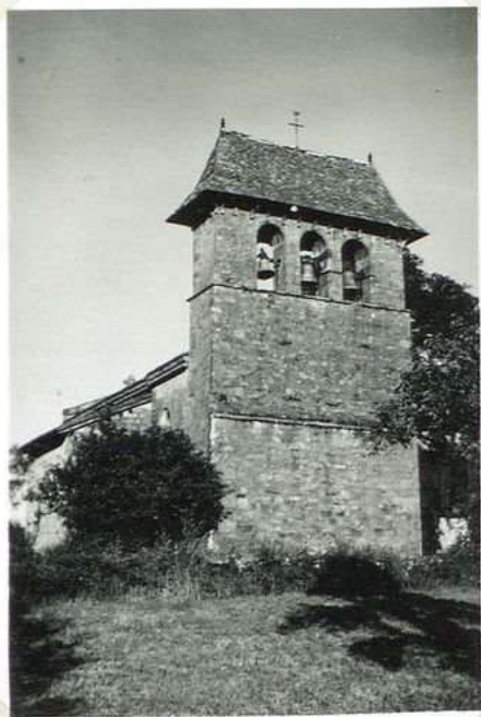
687 Eglise de Calviac