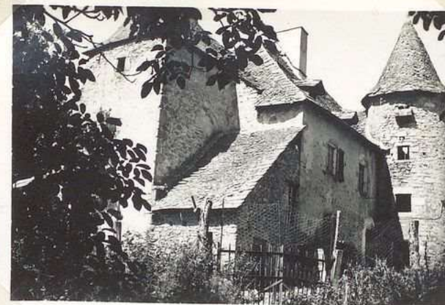
3528 Manoir de Traysse