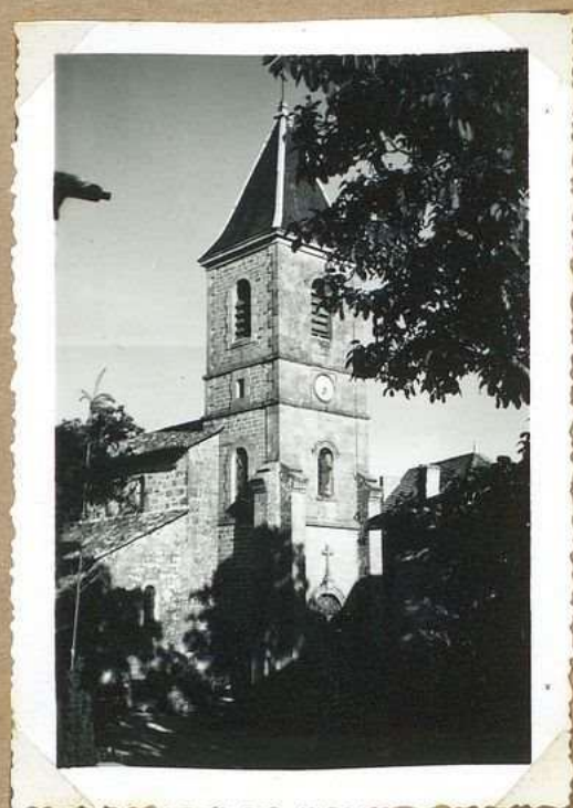
1067 - L'église