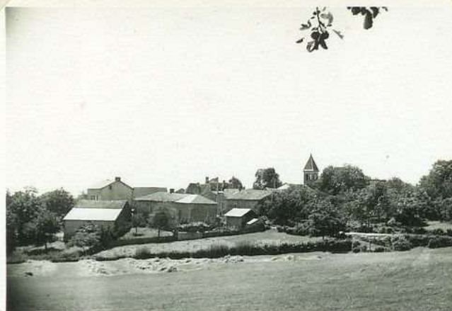
2008. Vue générale