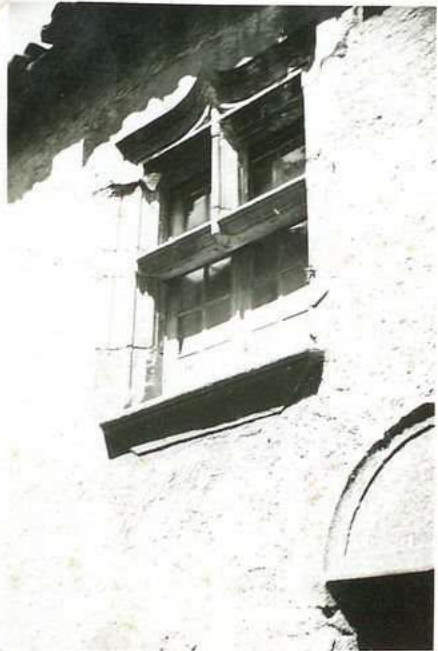
3524 Fenêtre XV e s.