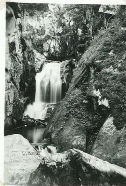
2004. Le Saut. Grand