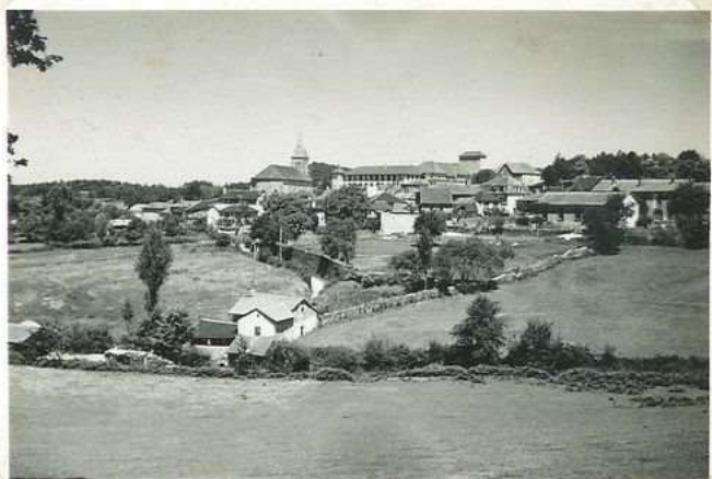
3525. Vue générale S