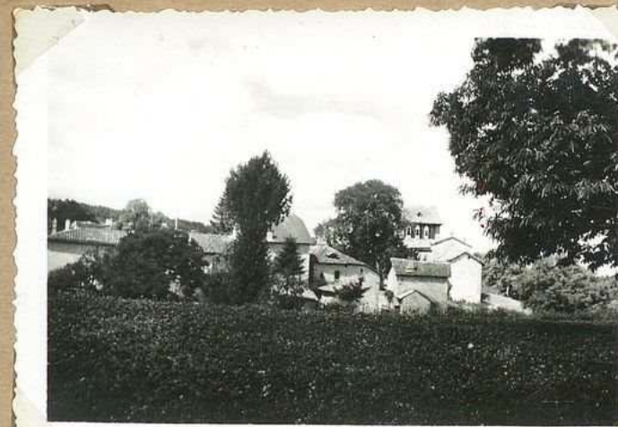
688. Vue générale E.