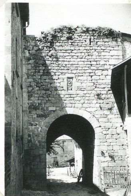
3523 Porte St Antoine