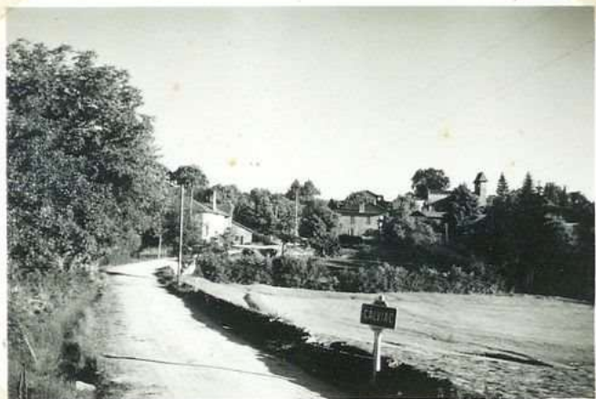
686 Vue générale N.