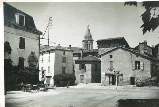
3526. Un coin de la place