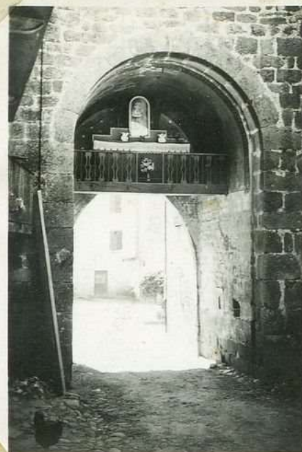
3520 Porte N. Dame. O