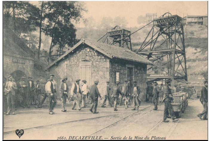
Sortie de la Mine à Decazeville

Le musée présente aussi différentes reconstitutions, comme celle d'un impressionnant coup de grisou – accident qui endeuilla bon nombre de famille du bassin houiller – et l'univers emblématique de la région. Six petits films viennent compléter cette présentation. Le musée possède également une très belle collection de lampes de mine ainsi que de plusieurs drapeaux et bannières corporatives.