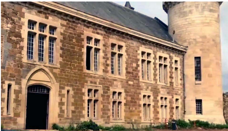
Le château de Lentillac-Saint-Blaise

sous la conduite de Abdellatif Mourchid , architecte en charge de la réhabilitation du château