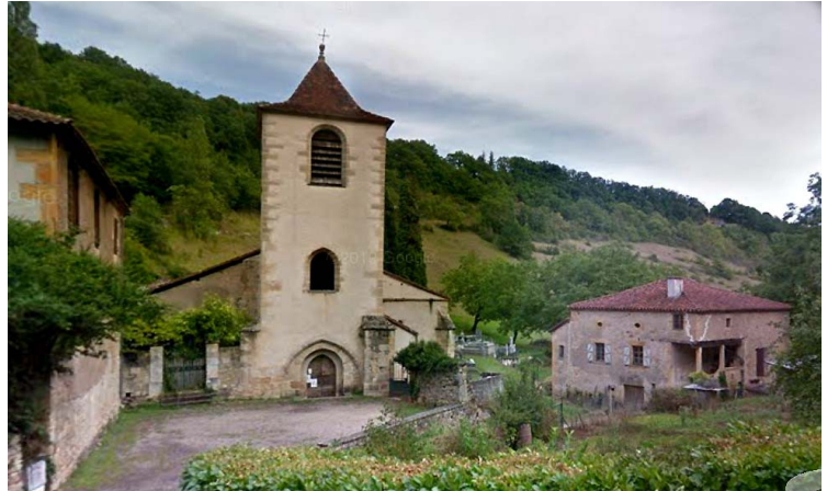
L'église Saint-Martin à Lunan

pour accueillir une sacristie et un baptistère. Une tour clocher s'élève au-dessus du porche d'entrée